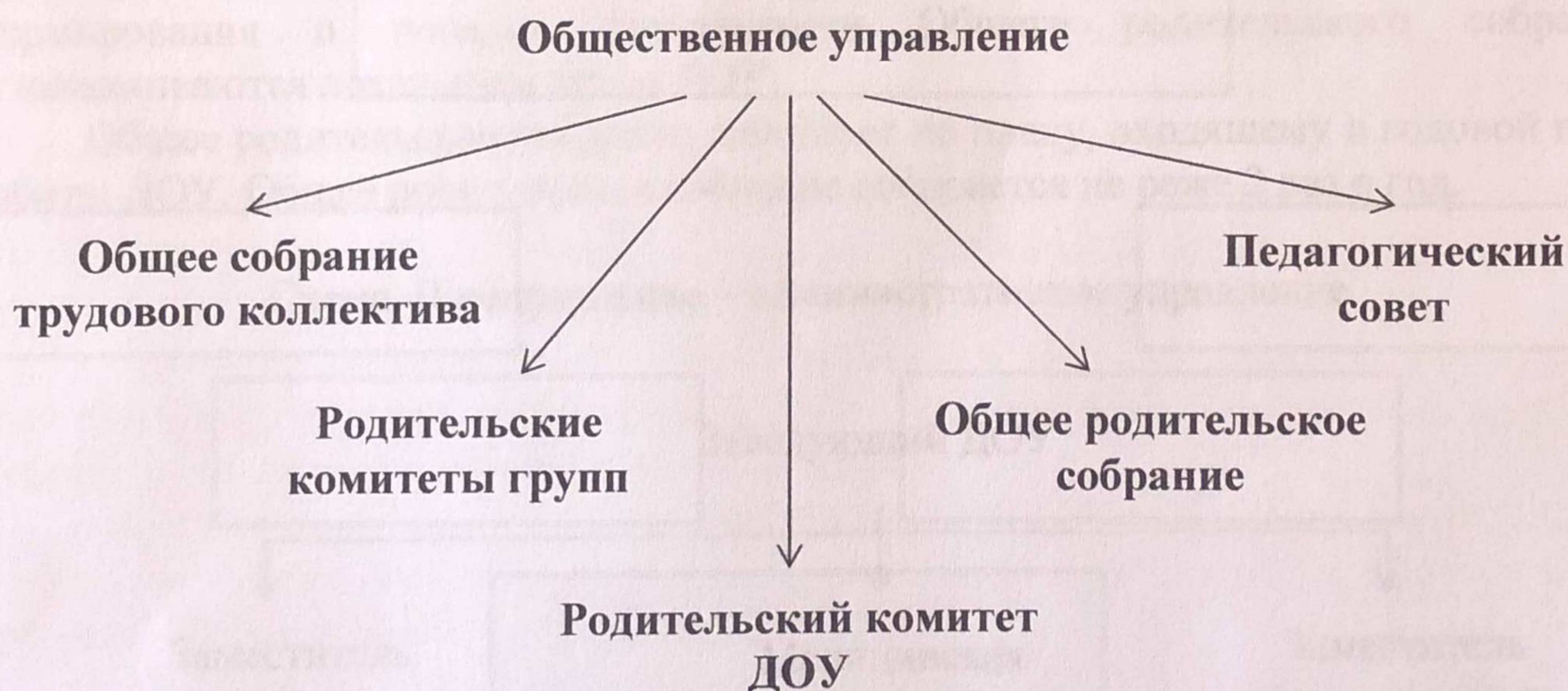
Схема. 1 направление – общественное управление ДООУ

Общее руководство ДООУ осуществляет Общее собрание трудового коллектива на основании Положения об Общем собрании трудового коллектива.